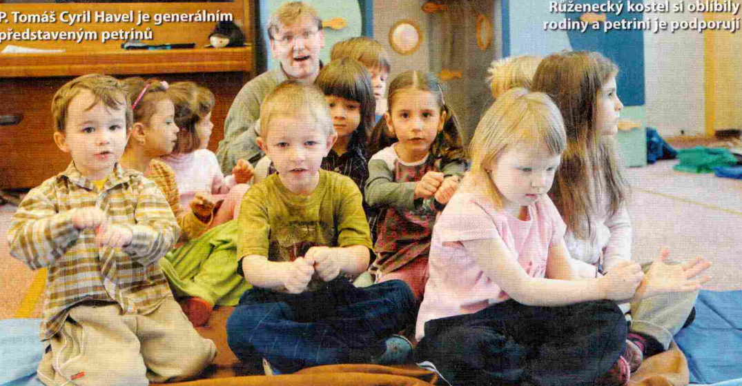
Růženecký kostel si oblíbili rodiny a petrini je podporují