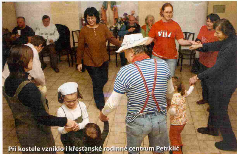
Při kostele vzniklo i křesťanské rodinné centrum Petrklíč

Jednou tatínek, znalec stínového divadla, hraje své představení, jindy někdo přivede kamaráda, aby informoval o mléce nikoli z krabičky, ale od kravičky, pak se zase šijí z látky hlavolamy a do toho všeho se míchají masopustní reje i svatovítské hrátky s ohněm a kovadlinou. Představený kongregace, dvaatřicetile-